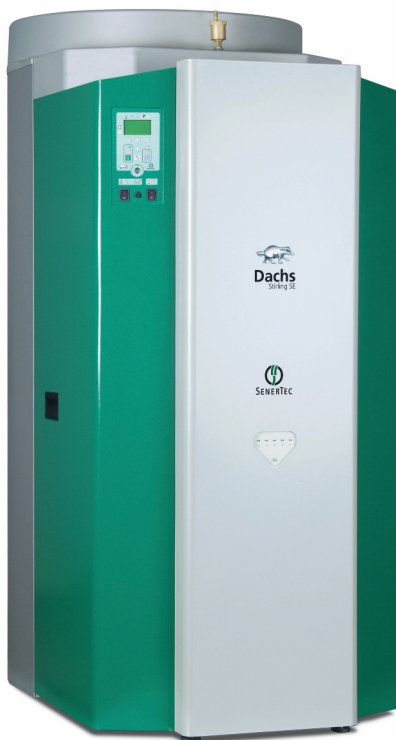
Dachs Stirling SE

Fossile Brennstoffe sind zu kostbar, um sie nur einfach zu nutzen. Zeitgemäße Heizungssysteme erzeugen daher nach dem Prinzip der Kraft-Wärme-Kopplung (KWK) nicht nur Wärme, sondern auch Strom. Mit einer thermischen Leistung von 5,8 kW und einer elektrischen Leistung von bis zu 1 kW eignet sich der Dachs Stirling SE ideal für die Energieversorgung von Einfamilienhäusern mit geringem Wärmebedarf. Zeitweise anfallende Bedarfsspitzen an Wärme deckt ein zusätzlicher, im Gerät integrierter 18-kW-Brenner ab. Der erzeugte Strom wird im Haus genutzt und der Stromüberschuss gegen eine Einspeisevergütung in das öffentliche Versorgungsnetz eingespeist.